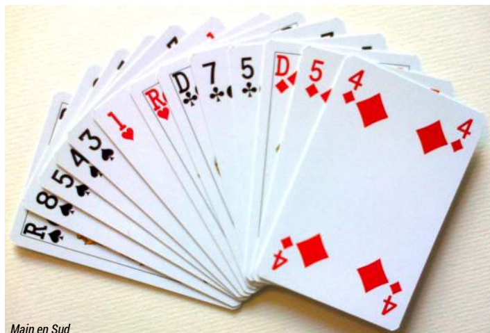
Main en Sud

manche, je me contenterais donc de vous rappeler que l'essentiel reste une bonne mise au point avec votre partenaire.