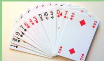
La main d'Est

Avant dernière donne du premier segment. Nous sommes en EO.